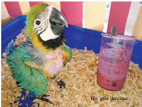
На два месеца

Само за три месеца безпомощното голо пиле се превърна в истински красавец, гордост за породата си.