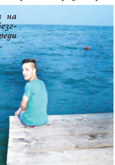
Боги се радва на последното беззрижко лято преди Университета.

Горнооряховската Шерпевица е в Слънчев бряг. Деси обаче съвместява плажа с професионални ангажименти. Гласовитата чаровница пее в бясково казино. Съвсем наскоро талантливата горнооряховчанка имала невероятния шанс да се срещне и разговаря с